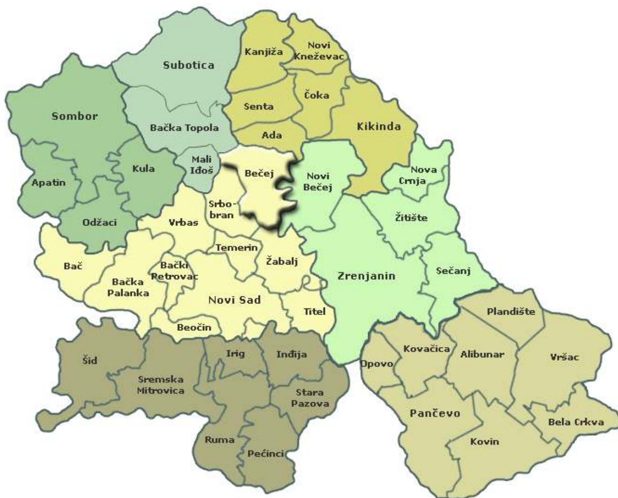
Положај општине Бечеј у АПВ

У оквиру АП Војводине Општина заузима положај који је само мало северније од строгог географског центра Покрајине. Захваљујући добро развијеној саобраћајној мрежи, Општина је доста добро и равномерно повезана са свим деловима Војводине. Ова чињеница има свој реалан значај због протока роба са врло широког подручја.