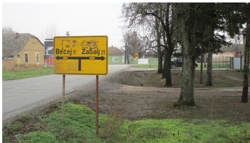
Слика 2: Фотографије постојећег стања са терена